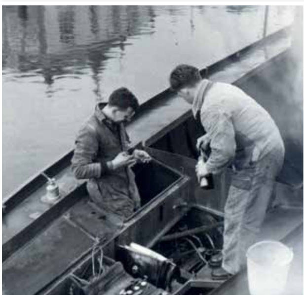
De Mercedes motor wordt geplaatst.