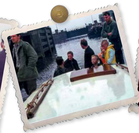
Door de sluis in Engelen.