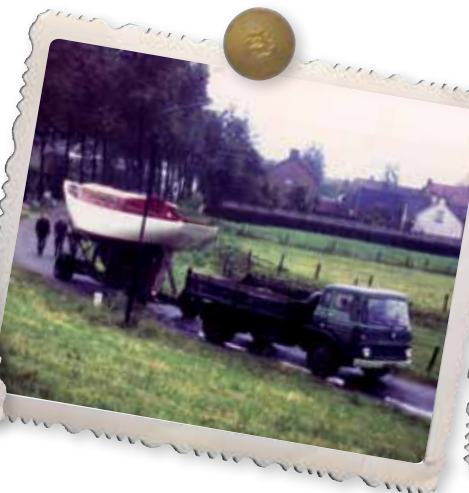
Binnendoor naar Heusden.