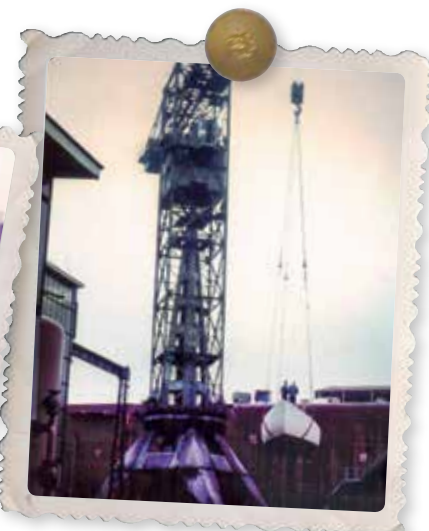
In de takels op weg naar het water.

veel getimmerd en geschaafd worden. Net in die tijd werden de grote teakhouten sluisdeuren vervangen. Prachtig en nog goed te gebruiken hout voor dit doel, dus Jan was er als de kippen bij: van de deuren werden in Schijndel planken gezaagd, die nodig waren voor de opbouw van het schip.