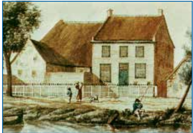
Dit schilderij van het huis is rond 1800 gemaakt.