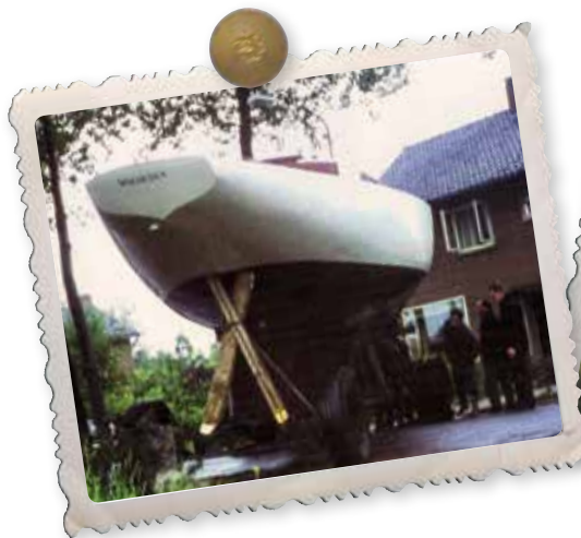
De Breaksea is klaar voor vertrek.