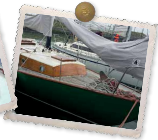
Op zijn ligplaats in Drimmelen.

Half juli ging het gezin op vakantie naar Zeeland, waar de Breaksea inmiddels naar toe was gevaren. Maar er was nog geen mast (moest nog voor gespaard worden, want die moest helemaal uit Amerika, Oregon komen) er waren nog geen zeilen en dan is zo'n boot net een pieremachochel, aldus Jeanne. Maar na een jaar sparen kon de hele familie, inclusief de kleintjes, gaan zeilen over de Nederlandse wateren en zelfs ook een enkele keer Het Kanaal oversteken. En het mooie is: de boot is nu in bezit van een van de zonen en ook de kleinzonen hebben het gen van hun grootvader geërfd.