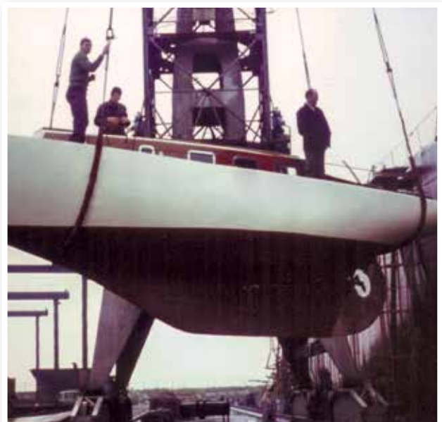
De tewaterlating vanaf de werf in Heusden.