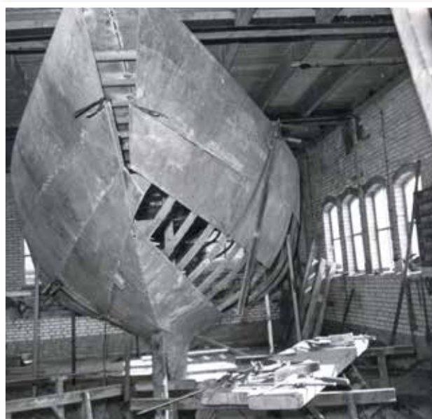
De boot in de schuur op de werf in Willemstad.

In het voorjaar van 1967 is de boot te water gegaan. Ja, dat staat er nou zo nuchter, maar ook dat was een hele klus: het was wat je noemt: uitzonderlijk vervoer. Dus men besloot om 5 uur in de morgen op zaterdag te vertrekken. Over de normale weg mocht niet; het moest binnendoor langs Bokhoven en over polderwegen richting Heusden. Daar, op de scheepswerf van Verolme is de boot gedoopt door Jeanne, die op alle dagen liep van haar dochter Sigrid, gadeslagen door vele belangstellenden. Daarna ging het met de hele bubs naar Engelen, waar een klein feestje werd gevierd.