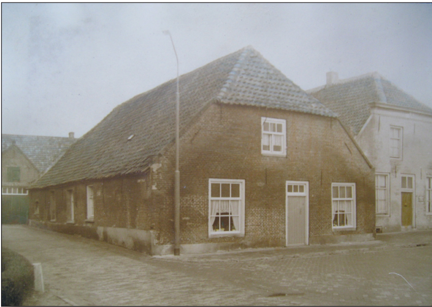
Afb. 6 Graaf van Solmsweg 55 omstreeks 1957. Links is nog een gedeelte van de voormalige smederij zichtbaar.

(deels zichtbaar op afb. 6) afbrandde en men bang was hetzelfde lot te ondergaan als honderd jaar eerder. Gelukkig bleef dit hen bespaard.