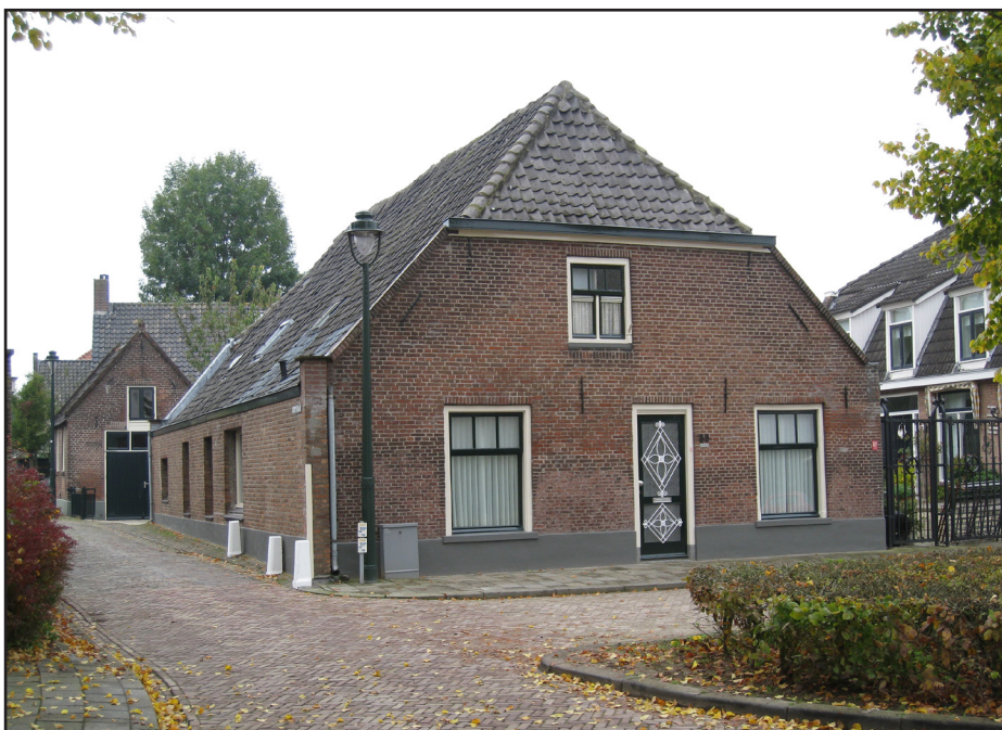
Afb. 1 Graaf van Solmsweg 55 met links de bijbehorende garage.

In dit artikel beschrijft Bertie Geerts de geschiedenis van een van de panden en perceel aan de Graaf van Solmsweg in Engelen. Hij bestudeert al vele jaren de kadastrale leggers van de huizen en boerderijen in Engelen. Op deze manier verzamelt hij een schat aan gegevens, die ons meer leert van de historie van het dorp aan de Dieze.