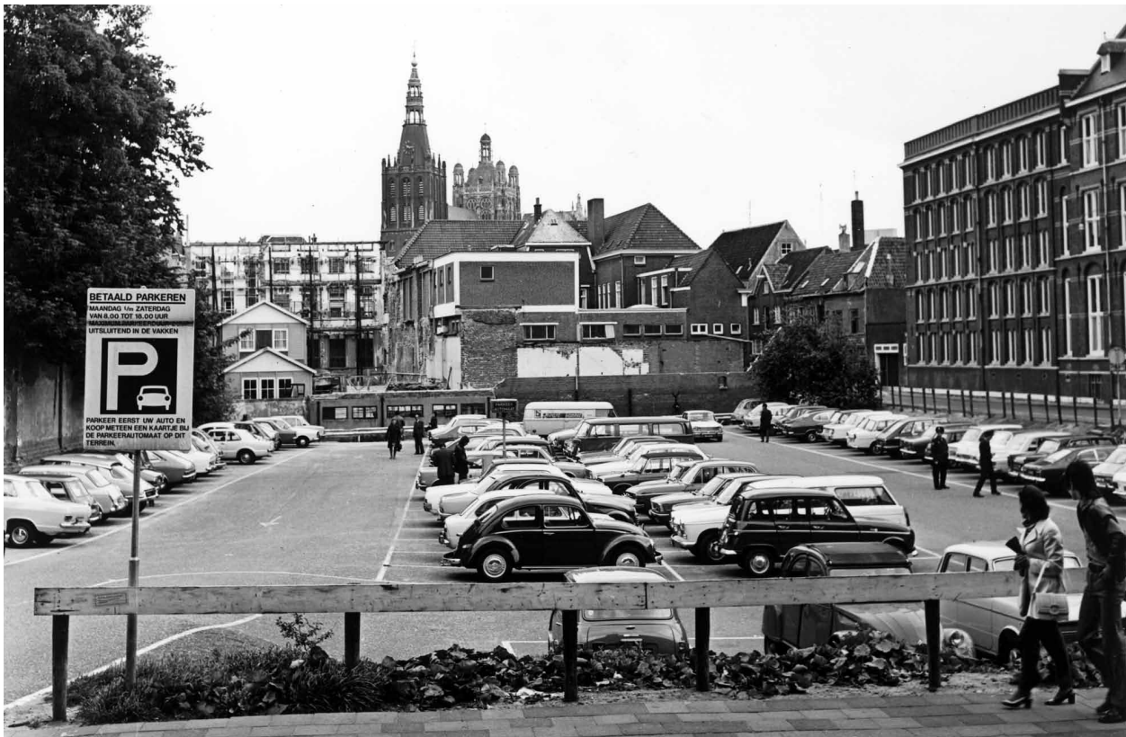
Er voor in de plaats: de parkeerplaats. De provincie wilde hier een nieuw provinciehuis van 60 meter hoogte realiseren en liet de bestaande bebouwing in 1961 slopen. De foto dateert uit 1974. Rechts het gebouw waar voorheen de Provinciale Griffie zetelde. De 'parkeerkuil' veranderde later in een parkeergarage.