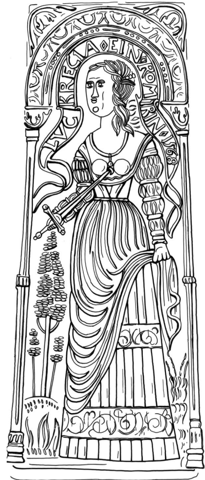
Tekeningen van de reliëfs op de 'schnelle': Judith, Esther en Lucretia. (Tekeningen: BAM).

ongedaan maakt. Haman zelf wordt gedood in plaats van de Joden die hij als doelwit had.