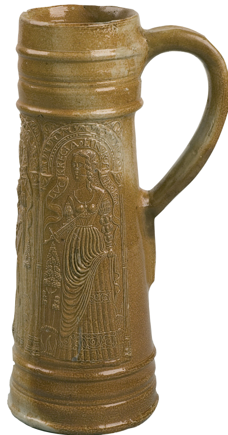
De 'schnelle' met Lucretia.

Om een antwoord op deze vragen te vinden, bekijken we eerst de voorstellingen. Links, met het gezicht naar het midden gekeerd, is Judith afgebeeld. Zij houdt in de rechterhand een zwaard en in de linker het afgehakte hoofd van Holofernes. Boven haar staat in de banderol de naam IVDIT en het jaartal 1568. Zoals verteld wordt in het apocriefe Bijbelboek dat haar naam draagt, was Judith een mooie en rijke Joodse weduwe die, toen haar stad door de Assyriërs belegerd werd, zich begaf naar het vijandelijke legerkamp. De legeraanvoerder Holofernes daar is onder de indruk van haar schoonheid en wijsheid, richt een feestmaal aan en na afloop blijft ze alleen met de beschonken aanvoerder achter in