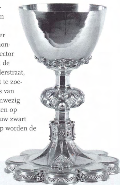
In 1621 verwierf het weeshuis een zilveren kelk die in Utrecht vervaardigd werd door een zilversmid uit de familie Van Weede. Thans in bruikleen bij het Noordbrabants Museum.

Hij wil in de Sint-Jan begraven worden in het graf van zijn al overleden broer mr. Roelof van Uden. Dat lag vóór de plaats waar het heilig sacrament stond opgesteld. Hij vraagt een zerk met een sobere tekst op het graf en daarbij of boven een 'tafereel' (schildering) van de gekruisigde Christus. De executeurs kunnen dit vinden op het tresoor voor in zijn huis. De uitvaart zelf moet wel binnen de perken blijven. Alleen de erfgenamen die in de stad wonen krijgen een uitnodiging, maar zij mogen niet logeren en teren in het huis aan de Kerkstraat. Als reden geeft de testator op dat dit huis daarvoor te klein is en dat hij niet wil dat de een meer krijgt (lees: eet en drinkt) dan de ander. De buiten de stad wonende talrijke erfgenamen hoeven niet te worden uitgenodigd want dan zouden ze te veel aan reiskosten moeten spenderen. Welkom zijn wel de paters van het Sint-Geertrui-klooster en van de kloosters Achter de Tolbrug en de Windmolenberg, verder de priors van de Predikheren, de Kruisbroeders en de Bogarden en de pater van het in Rosmalen gelegen nonnenklooster Annenborch. De rector van een ander convent, dat van de Arme Fraterkens aan de Schilderstraat, wordt verzocht 20 kinderen uit te zoeken die ieder met een waskaars van 3 pond zwaar op de uitvaart aanwezig moeten zijn. De kleintjes moeten op kosten van het sterfhuis in nieuw zwart laken worden gehuld. Na afloop worden de kaarsen die dan nog niet opgebrand zijn, verdeeld over