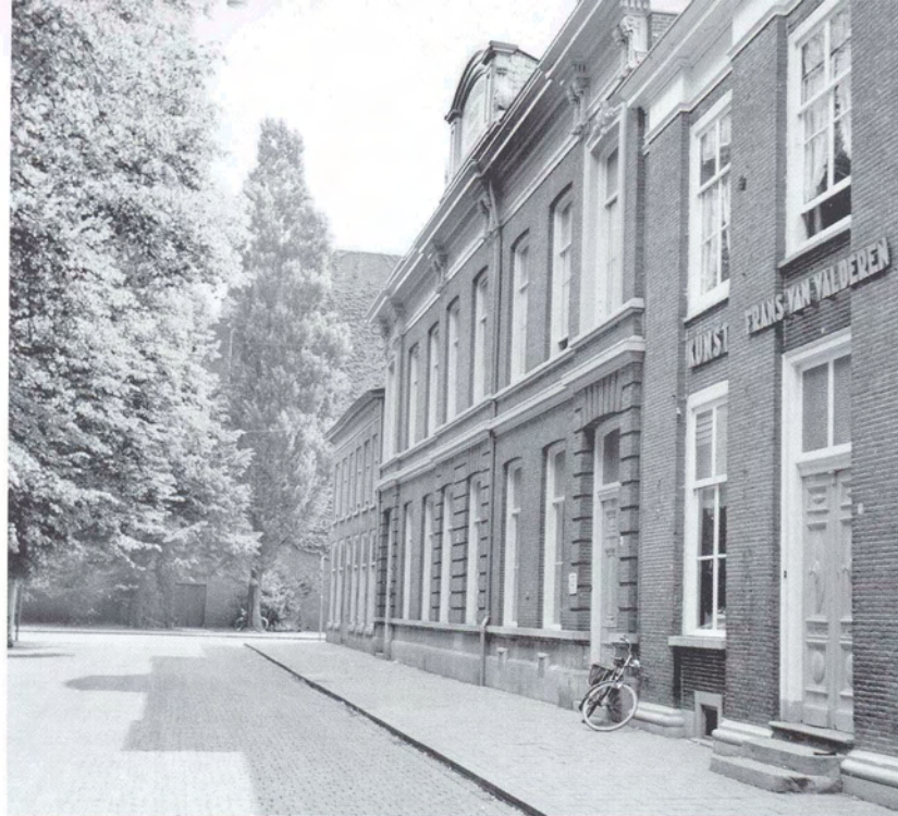
Het pand aan de Parade waar het weeshuis van 1566 tot 1934 gevestigd was (vroeger stond deze zijde daarom bekend als de Weesstraat).

altaren, kerken en conventen in de stad. Wanneer de kist eenmaal gedaald is kan er gegeten worden. De executeurs zorgen voor een maaltijd, maar die mag niet zo duur uitvallen als die welke Frans zelf destijds voor zijn eigen broer liet aanrichten. Oude ervaren lieden hebben hem dit aangeraden.