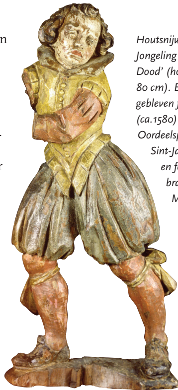
Houtsnijwerk 'De Jongeling en de Dood' (hoogte ca. 80 cm). Bewaard gebleven fragment (ca.1580) van het Oordeelspel uit de Sint-Jan. (Origineel en foto: Noordbrabants Museum).

In onze wereld van een kleine vijf eeuwen later staat dit alles ver van ons af. Wie is er nog bang voor de duivel? En ook al behoort de 'pastoraal van de angst' tot het verleden, met het verdwijnen van de duivel kwam in zekere zin ook God in het proces van secularisering in toenemende mate op de achtergrond te staan. In het oordeelspel spelen beiden een promi-