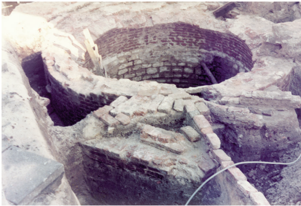
De archeologische resten in 1977 van de middeleeuwse waterput op de Markt, die van oudsher het centrum van de stad markeerde. De put, waarvan de reconstructie van het puthuis bij de recente herinrichting van de Markt is verwijderd, zal evenwel in het planologisch zichtbaar gemaakt worden. 's-Hertogenbosch heeft dan ook behoefte aan een vergetelput.