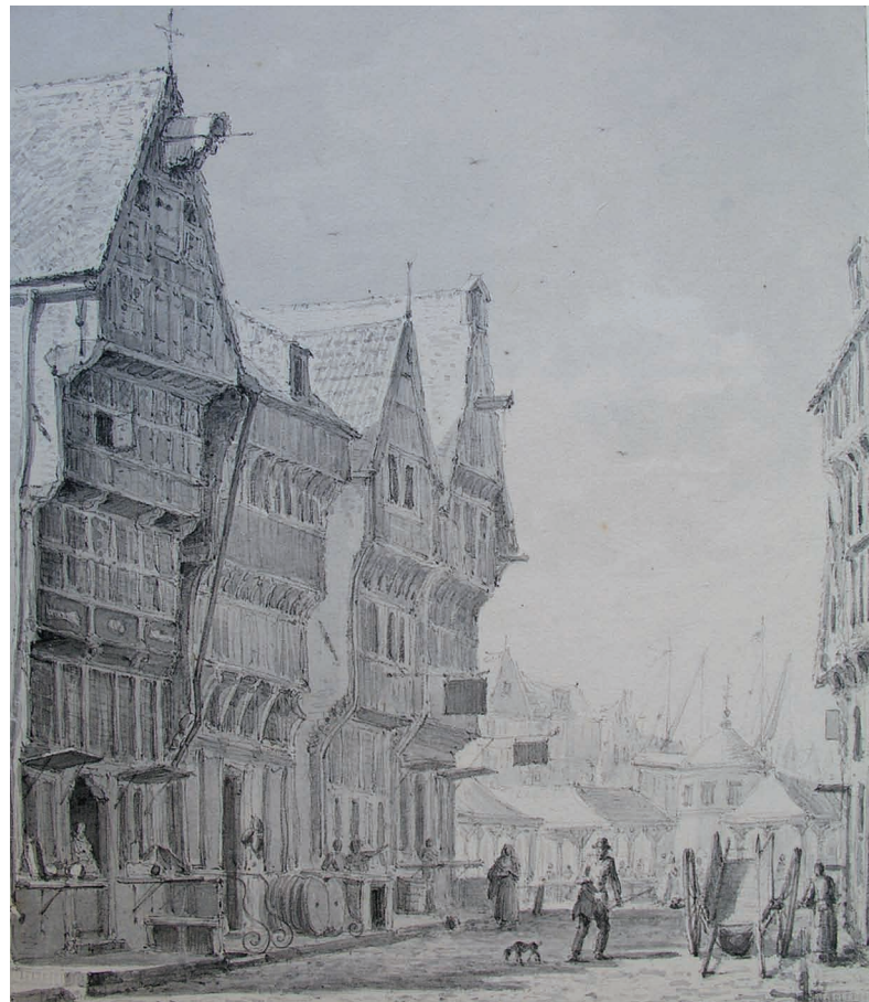
Huizen met houten gevels aan de westzijde van de Kruisstraat richting Vismarkt (thans Visstraat). Op de achtergrond van deze tekening van J. Jelgerhuis (1827) links de zogeheten visbanken waar de viskopers hun waar verkochten. Tal van ambachtsgilden lieten gereformeerden als lid toe. Het slagers- en het viskopersgilde werden echter gereformeerde beroepsgenoten. Speelde het geloof werkelijk een rol? Of wilden de slagers en viskopers de vleeshal en visbanken in de familie houden? (Origineel: UvT, Brabant Collectie; foto: Stadsarchief)

Weinig verrassend ontsnapten ook de schutterijen niet aan de gevolgen van de religieuze en staatkundige troebelen. Tussen 1629 en 1643 werd de katholieke schutters wapen, vaandel en bijgevolg eer en identiteit ontnomen. Daarna werden de schutterijen gereorganiseerd en impliciet onder gereformeerd gezag geplaatst. Dit was om meerdere redenen een interessante zet van de gereformeerde machthebbers. Immers, de meer gegoede poorters van de stad bevolkten de vier Bossche schutterijen; men moest namelijk de eigen, prijzige, wapenrusting bekostigen. Bovenal creëerden en versterkten de ‘borgercompagnieën’ de stedelijke identiteit van haar leden. ‘Edel Manhaftigh en garde der Stadt, Dees eer hebben wij altijd gehad’, aldus een trefende versregel uit 1744 (p. 73). Door katholieken en gereformeerden expliciet te vermengen hoopte men de tegenstellingen weg te masseren – en drinken – wat zoals blijkt uit de verder incidentarme geschiedenis van de schutterijen goeddeels lukte ook. Vos legt een sterke nadruk op het verbindende karakter van deze instellingen, waarbinnen trouw aan en trots op de stad de religieuze verschillen schijnbaar uitvlakten tot een ‘omgangsoecumene’. Verder beschrijft hij de geschiedenis, werking en verantwoordelijkheden van de schutterijen in detail.