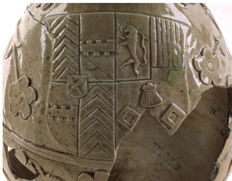
Afb. 5. Het alliantiewapen Egmond-van Bergen op de bokaal.

het overlijden zonder wettige nakomelingen van Hendrik van Deventer in 1556 of bij de dood van zijn weduwe in 1564. In elk geval is bij deze gelegenheid ook de bokaal in de beerput terecht gekomen. Hierbij moeten we wel bedenken, dat de datering van de context de datum weergeeft waarop het voorwerp in de put terecht kwam. Het kan lang in gebruik zijn geweest vóór het in de beerput werd gedeponeerd. Opmerkelijk is dat de bokaal samen met het losse dekseel is aangetroffen, zodat aangenomen mag worden dat het voorwerp als geheel bij elkaar is gebleven tot het in de beerput terecht kwam. De tweede dateringmogelijkheid levert meer moeilijkheden op, omdat qua vorm vergelijkbare trechterbekers uit Siegburg steengoed met een vergelijkbare decoratie niet bekend zijn. De toegepaste versieringstechniek geeft echter wel een globale aanwijzing voor een datering. Zo zijn er wel kleinere Siegburg trechterbekers bekend met uitgesneden decoraties van distelblaadjes, schematische wapenschilden en letters. Van dit type zijn ook een aantal exemplaren bekend uit 's-Hertogenbosch, één zelfs uit dezelfde afval-laag uit de beerput van het Keizershof, waaruit ook de bokaal afkomstig is, voorzien van ingesneden distelblaadjes en de uitgesneden letters wvB (afb. 6). 6 Er zijn echter ook enkele voorbeelden van uitgesneden decoraties op producten uit Siegburg, die, evenals bij de Bossche bokaal, als waren ze opgeplakt, op het oppervlak lijken te lig-