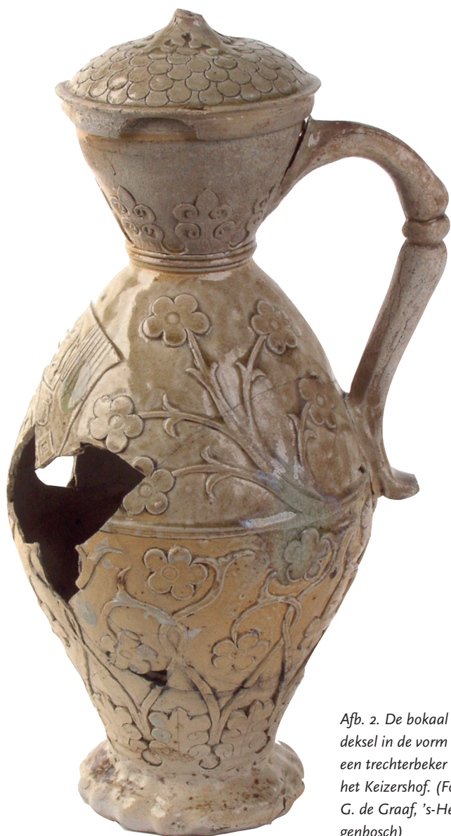
Afb. 2. De bokaal met deksel in de vorm van een trechterbeker uit het Keizershof.