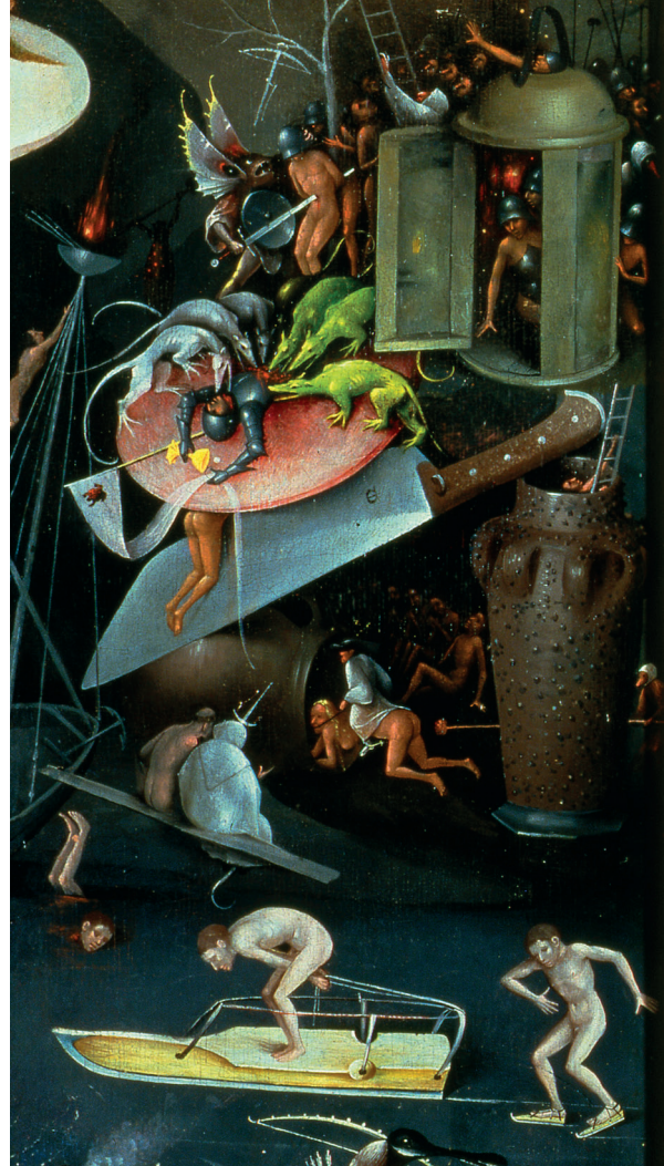
Afb. 8. Bokaal uit Loschitz (Moravië) op rechter paneel van Jheronimus Bosch' Tuin der Lusten .

appel?) keert terug aan de voet van de kelk van de bokaal en bekroonde waarschijnlijk oorspronkelijk als knop de geschubde deksel, die het verenkleed van vogelveren kan hebben gesymboliseerd. Blijft nog de vraag waarom een dergelijke kostbare bokaal, waarvoor waarschijnlijk toch de hulp is ingeroepen van een professionele graveur of goudc.q. zilversmid, niet in edelmetaal zoals goud of zilver is uitgevoerd. Diverse details van de bokaal, zoals de bolvormige insnoering halverwege het oor en vooral de uitstaande onderbevestiging daarvan en de geschubde bovenzijde van het deksel, doen ook eerder aan graveerwerk in zilver denken dan aan aardewerk. Het antwoord kan misschien worden gezocht in het uitheemse, exotische effect van de uitvoering, niet in het eeuwige saaie zilver, maar in ongewoon, nieuw, hoogwaardig en rijk gedecoreerd steengoed. Op deze manier kan de bokaal juist hebben aangesloten bij de verzamelzucht van de Bourgondische aristocraten uit deze periode, die elkaar beconcurrerden met rareitencabinetten, waarin allerlei uitheemse voorwerpen werden bijeengebracht. In de inventarissen hiervan treffen we