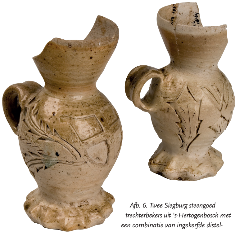
Afb. 6. Twee Sieburg steengoed trechterbekers uit 's-Hertogenbosch met een combinatie van ingekerfde distelblaadjes en (links) een ingekerfd wapenschild en rechts de letters wvB. Links afkomstig uit beerput F-33 uit de opgraving Postelstraat (1978), rechts uit de beerput F-200 uit het Keizershof.

gen. 7 Voorzover de beschikbare informatie nu reikt, lijkt het erop dat in Sieburg de decoratietechniek bestaande uit uitgesneden en/of ingekerfde decoraties vooral werd toegepast aan het einde van de vijftiende en het begin van de zestiende eeuw. Daarna lijkt deze techniek in Sieburg plaats te maken voor reliëfs en medaillons, die door middel van in mallen uitgedrukte appliques op de voorwerpen werden aangebracht. 8