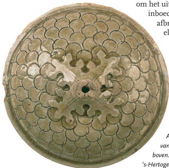
Afb. 4. Het dekseel van de bokaal van boven.

Het is denkbaar dat een dergelijke situatie zich heeft voorgedaan na