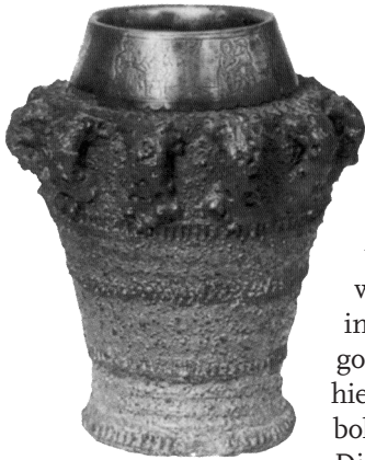
Afb. 9. Pronkbeker, steengoed Loschitz (Moravië), ca. 1475-1500. (Museum für Angewandte Kunst, Keulen)

ook grillig en ongewoon aardewerk (en steengoed) aan. 16 Het was een 'hype' in de wereld van de internationaal georiënteerde Bourgondische aristocratie, waar ook de hierboven genoemde grillig gevormde bokalen uit Loschitz bekend waren.