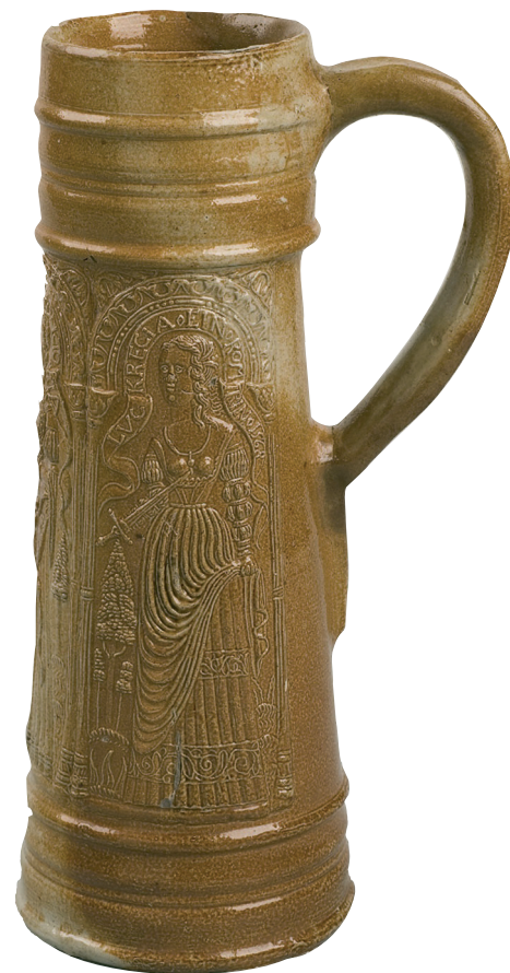
De 'schnelle' met Lucretia. (Foto: BAM).

Om een antwoord op deze vragen te vinden, bekijken we eerst de voorstellingen. Links, met het gezicht naar het midden gekeerd, is Judith afgebeeld. Zij houdt in de rechterhand een zwaard en in de linker het afgehakte hoofd van Holofernes. Boven haar staat in de banderol de naam IVDIT en het jaartal 1568. Zoals verteld wordt in het apocriefe Bijbelboek dat haar naam draagt, was Judith een mooie en rijke Joodse weduwe die, toen haar stad door de Assyriërs belegerd werd, zich begaf naar het vijandelijke legerkamp. De legeraanvoerder Holofernes daar is onder de indruk van haar schoonheid en wijsheid, richt een feestmaal aan en na afloop blijft ze alleen met de beschonken aanvoerder achter in