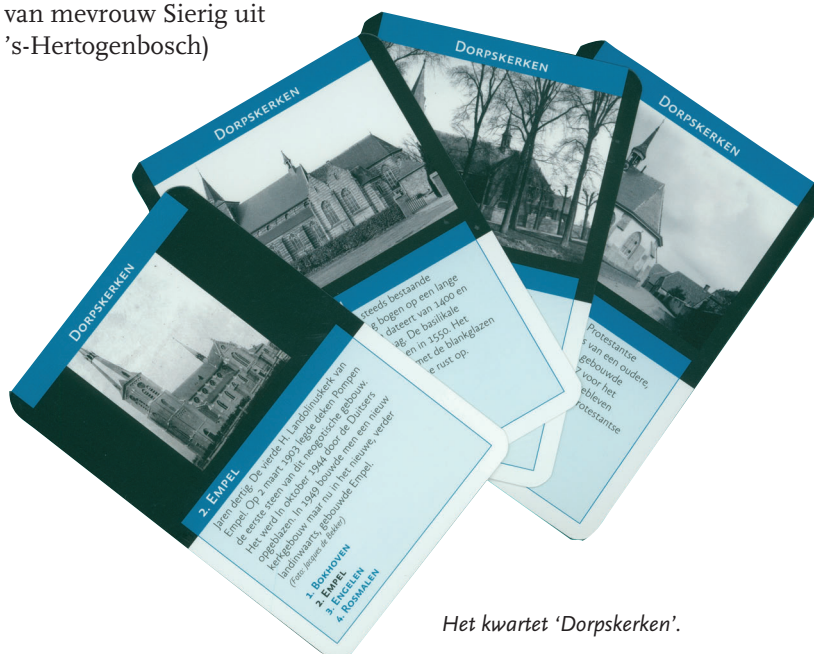
Het kwartet 'Dorpskerken'.

Tijdens de Avond van de Geschiedenis is het Bossche geschiedenis-kaartspel met als thema 'straten en pleinen' gepresenteerd. De uitgave was een groot succes want al snel moest er een tweede druk worden vervaardigd. Het kaartspel is voor €4,50 verkrijgbaar bij het Stadsarchief, boekhandels Heinen en Van Rooij-Krijnen (Helftheuvel), alsmede bij het Kringhuis van de Kring Vrienden (Lombardje) en het vvv-kantoor.