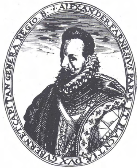
Portret van landvoogd Parma (uit: Pieter Bor, Nederlandsche Oorloghen 2e deel (1621) 13e boek fol. 68; Stadsarchief 's-Hertogenbosch, HTA, stamboeknr. 36827).

Inmiddels was in 1578 Alexander Farnese, prins van Parma, de landvoogd Don Juan opgevolgd. Hij sloeg het beleg voor Maastricht, nadat hij daarvoor Roermond al bezet had. Maastricht viel op 29 juni 1579, waarop de Spaanse soldaten zich te buiten gingen aan plundering en moord. Toen het lot van Maastricht op 1 juli in Den Bosch bekend werd, wakte dit zeer veel