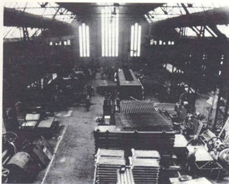
Interieur van de machinehal in 1942 (Stadsarchief 's-Hertogenbosch, Historisch-Topografische Atlas, Stamboeknr. 47.786).

bij het eeuwfeest van het bedrijf in 1958 door het personeel is aangeboden. De bronzen buste van oprichter Willem Grasso heeft nog steeds zijn centrale plaats in de hal behouden, ook al volgt de familie de activiteiten van het bedrijf sinds de jaren dertig nog slechts vanaf de zijlijn.