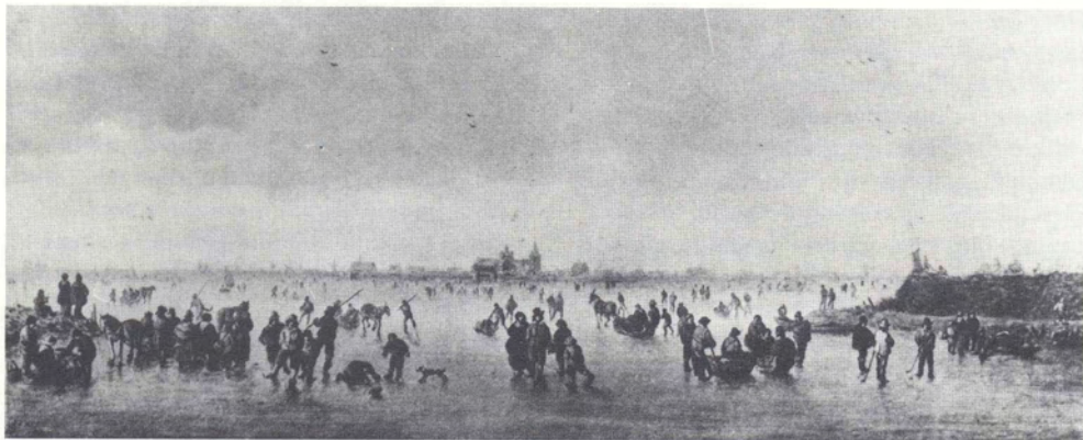
De jaarlijkse winterse wateroverlast had ook zijn plezierige kanten: over de gigantische ijsvlakten kon men vanuit 's-Hertogenbosch naar Vlijmen, Empel, Rosmalen en andere dorpen schaatsen, zoals dit schilderij laat zien (Jan van Goyen, 17e eeuw, part. coll.; foto Stadsarchief 's-Hertogenbosch, Historisch-Topografische Atlas, Stamboeknr. 125).

De Beerse Maas is het gevolg van een overlaat bij Beers. Als het water van de Maas een bepaalde waterstand bereikt, stroomt het over de verlaagde dijk Brabant binnen. Binnen enkele dagen staat dan het noordelijk deel van de provincie onder water. Vanuit 's-Hertogenbosch is de omgeving zeer beperkt bereikbaar: de meeste dorpen kunnen slechts per boot met 'de bewoonde wereld' in contact staan. Deze 'veerdiensten' vinden plaats met behulp van door de stad vastgestelde reglementen. Immers, ieder jaar zou het in de wintermaanden een regelmatig overlast zijn. De postillons die brieven vervoeren, zijn eveneens ernstig gehandicapt als het water weer toeslaat. De Hollandse rit bijvoorbeeld, die normaal plaatsvindt via de Sint-Janspoort, langs Vlijmen, Nieuwkuyk en Drunen, rijdt bij hoog water via de Vughterpoort over Cromvoirt en Helvoirt naar Drunen, een hele omweg. 5