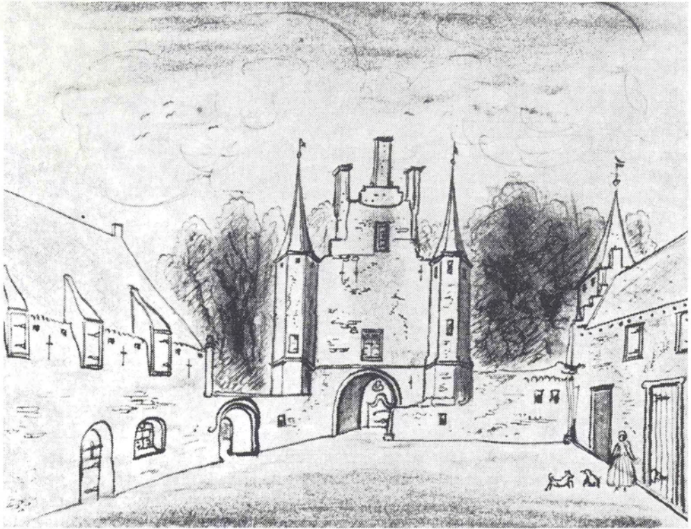
Afb. 1 De voorburch van het kasteel van Bokhoven in het begin van de 18e eeuw.

Natekening door A. C. Ph. Vogelsang; origineel onbekend (Collectie Stadsarchief 's-Hertogenbosch nr. 42839).