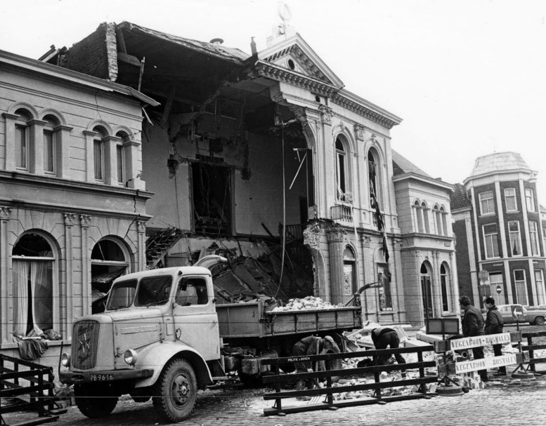
Weggeslagen gevel van het Concertgebouw aan de Jan Heinsstraat (opname uit 1965).

ren waren prima, maar veel sigarenmakers leden aan tuberculose, het sterftcijfer was hoog. 24 Toch stak de situatie bij Th. Houtman gunstig af bij andere sigarenfabrikanten. Er was een speciaal schaft-lokaal waar 's zomers water en melk en 's winters warme thee werd geschonken. Ventilatiemogelijkheden waren er ook, maar de sigarenmakers deden de ramen niet open. 25