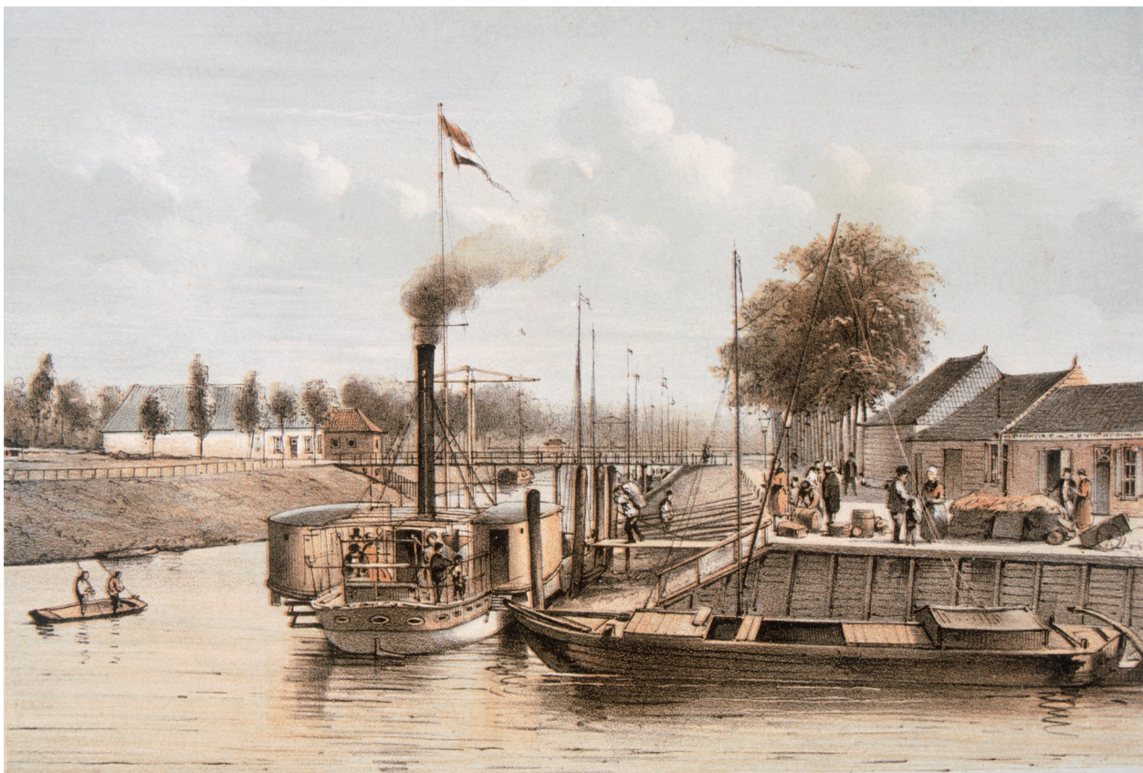
Vóór de Vestingwet van 1874 stonden er enkel (houten) gebouwen aan de rand van 'de' Plein. Litho uit 'Album 's-Hertogenbosch in 1860'.