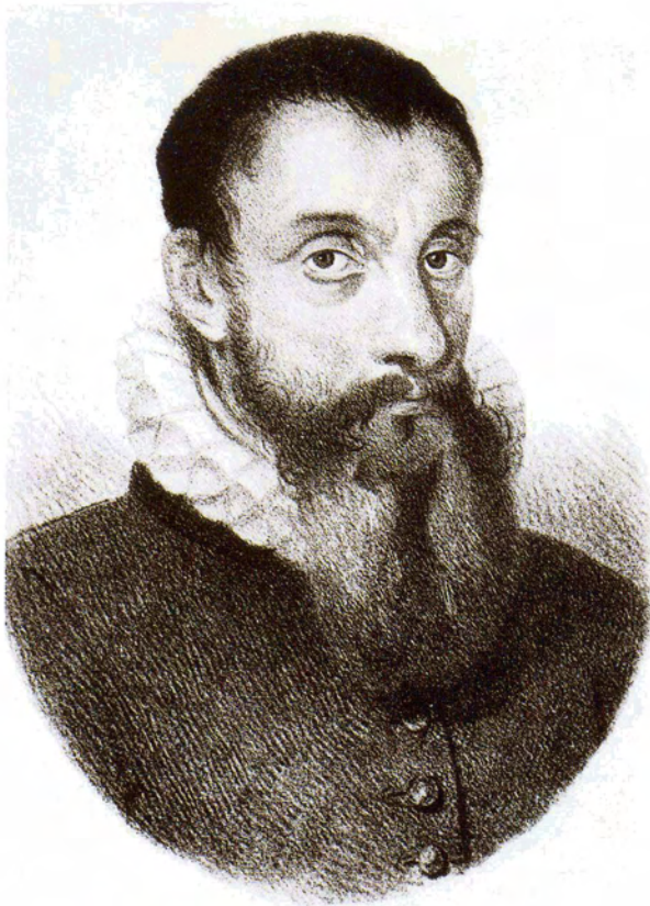
CHRISTOPHORUS VLADERACKEN of VAN VLADERACKEN, Rector der Schijffsche Scholen te Amstelredam en 's-Hertogenbosch 1551 — 1601.

Afb. 4. Christophorus Vladeracken, litho, midden 19e eeuw. Iconografisch Bureau, Den Haag.